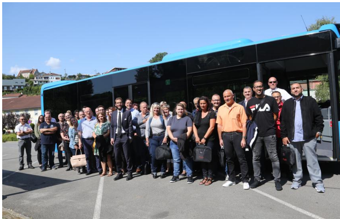
Les chauffeurs de bus sont prêts à accompagner les enfants pour une nouvelle année.

Certaines lignes scolaires profiteront de la présence d'un accompagnateur, notamment la 190 et