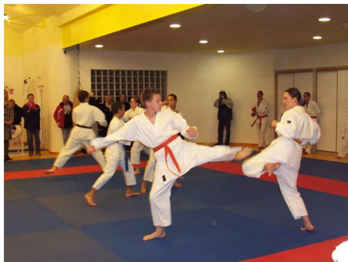
Le Karaté-club du Val de Briey reprendra les entraînements la semaine de la rentrée scolaire, au dojo Jean-Bonnetterre.