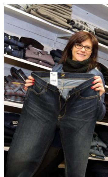
Un jeans pour homme à L'Arkansas.

Hier, pour le lancement des soldes d'hiver, on a poussé la porte de quelques magasins de Briey et demandé à chaque commerçant quel rabais il affichait immédiatement. Les professionnels nous ont également montré quels produits allaient, à coup sûr, recueillir les faveurs des clients. Revue de détail.