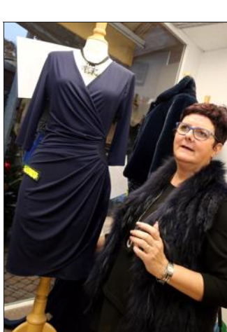
Une petite robe chez Anny Boutique.