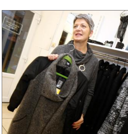
Un manteau original chez Lola Bay.