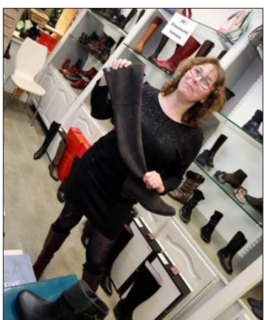
Des cuissardes chez Potern Chaussures.