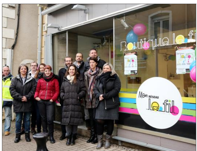
La nouvelle agence du réseau Le Fil place Thiers à Briey est ouverte du lundi au vendredi de 8 h 30 à 12 h et 14 h à 17 h, ainsi que le samedi de 8 h 30 à 12 h.

Ouvert ! Désormais, le réseau de transport Le Fil a son agence physique. Et c'est bien pratique, pour obtenir un maximum de renseignements concernant ce réseau de transport urbain et inter-urbain.